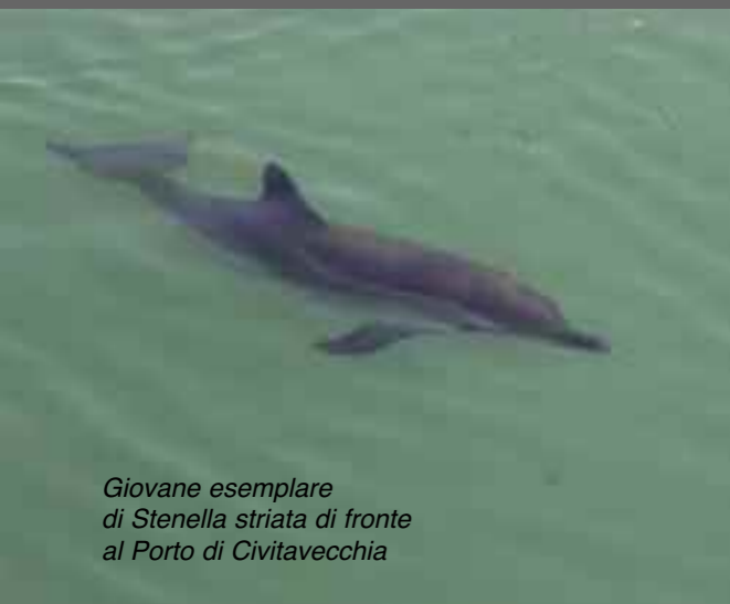
Giovane esemplare di Stenella striata di fronte al Porto di Civitavecchia