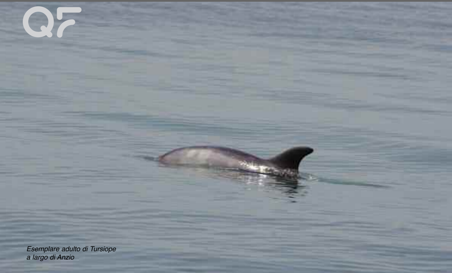
Esemplare adulto di Tursiope a largo di Anzio