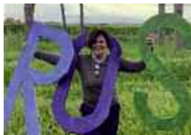
auguri doppi dalla tua famiglia, cara mammetta.