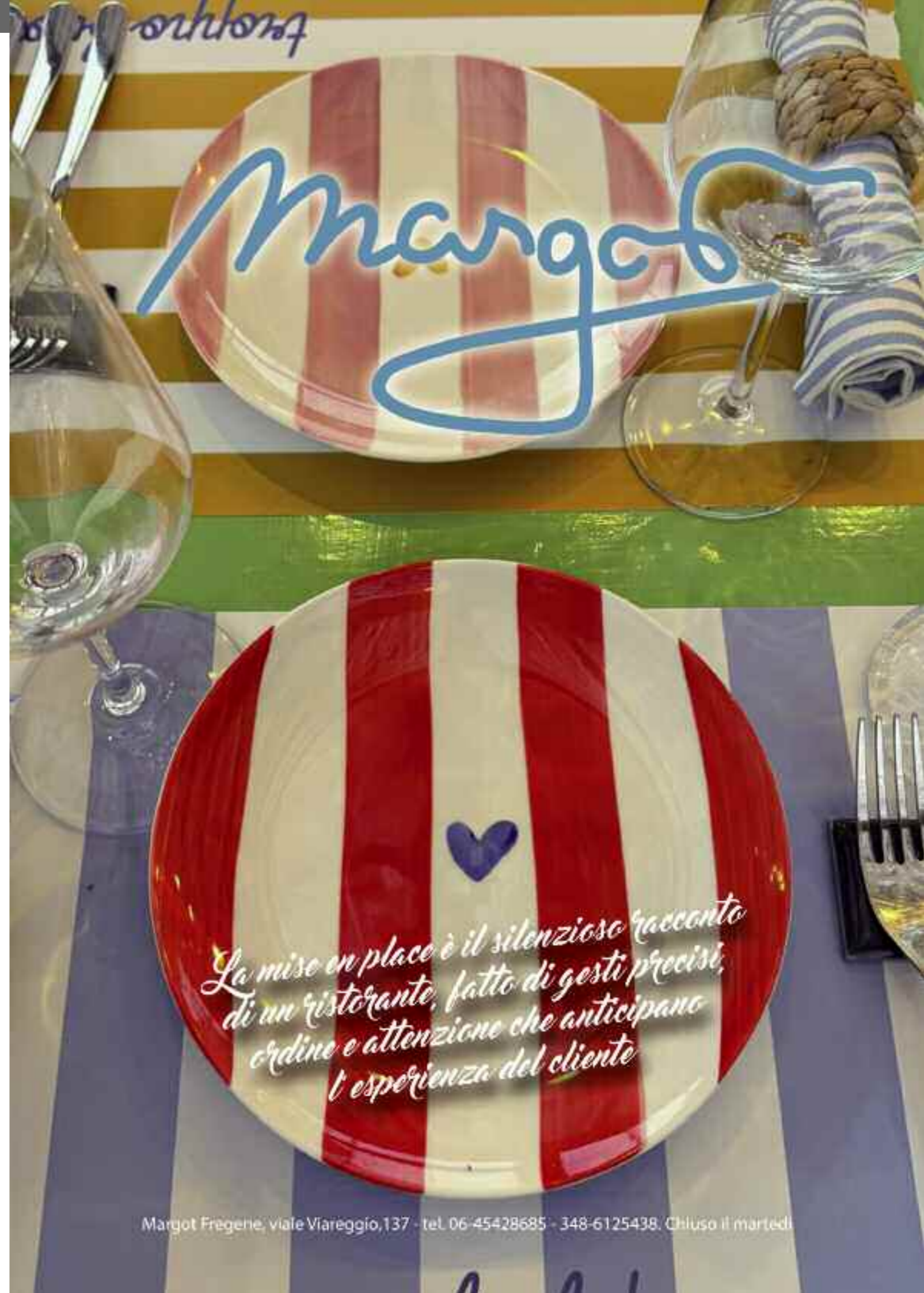
Margot Fregene, viale Viareggio, 137 - tel. 06-45428685 - 348-6125438. Chiuso il martedì