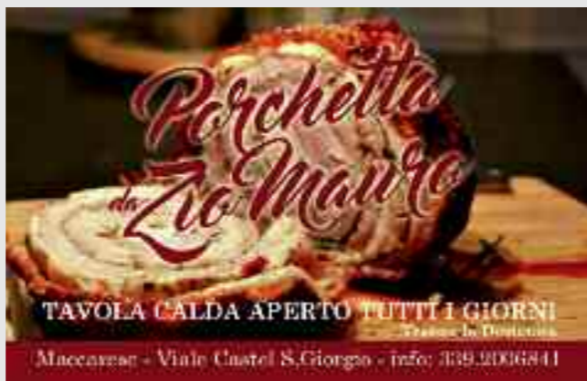
TAVOLA CALDA APERTO TUTTI I GIORNI Maccarese - Viale Castel S. Giorgio - info: 339.2006841

Lezioni Passeggiate Via Paraggi - Tel. 06/66560689